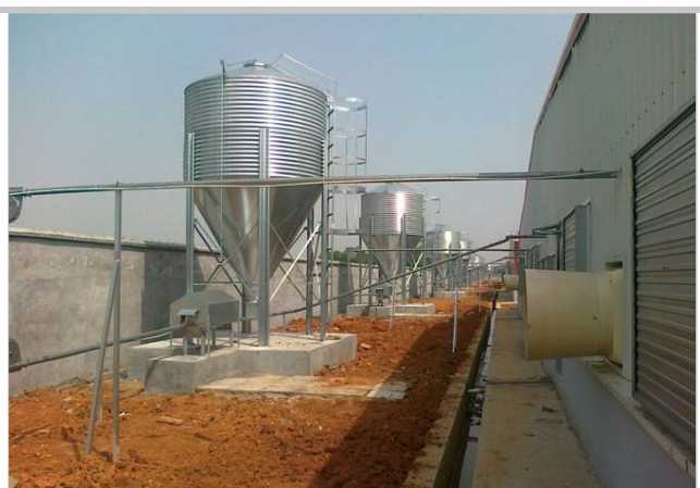
图 2：集约化猪场料塔